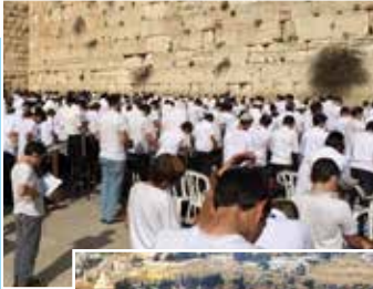
Kakaskukorékolás temploma Sion hegye