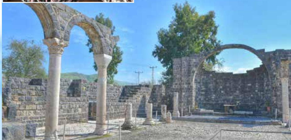
Kursi-a bibliai Gadara

Vacsora és szállás Haifán a Beth-Shalom hotelben. Este fakultatív áhítat és beszélgetés.